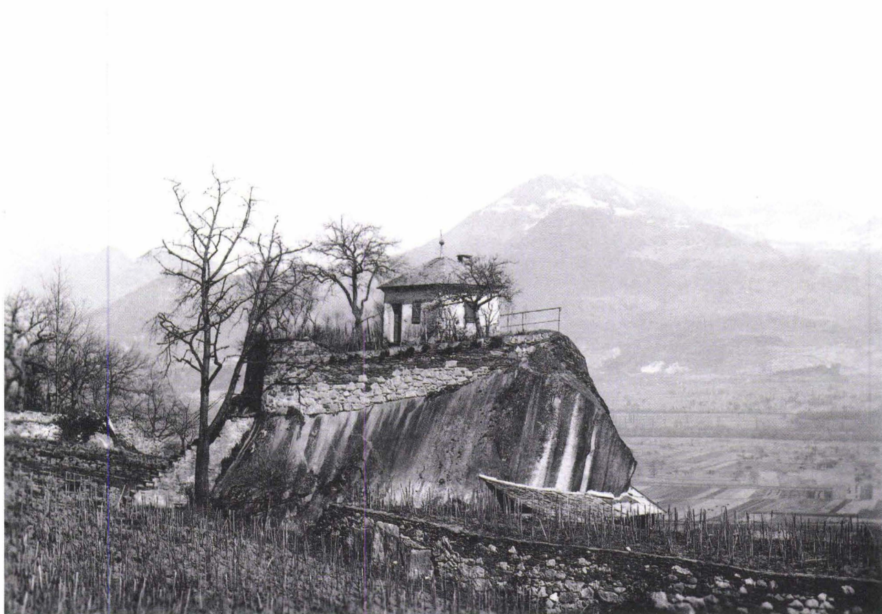
La Pierre des Marmettes (~1890 - 1906) Vieux-Monthey