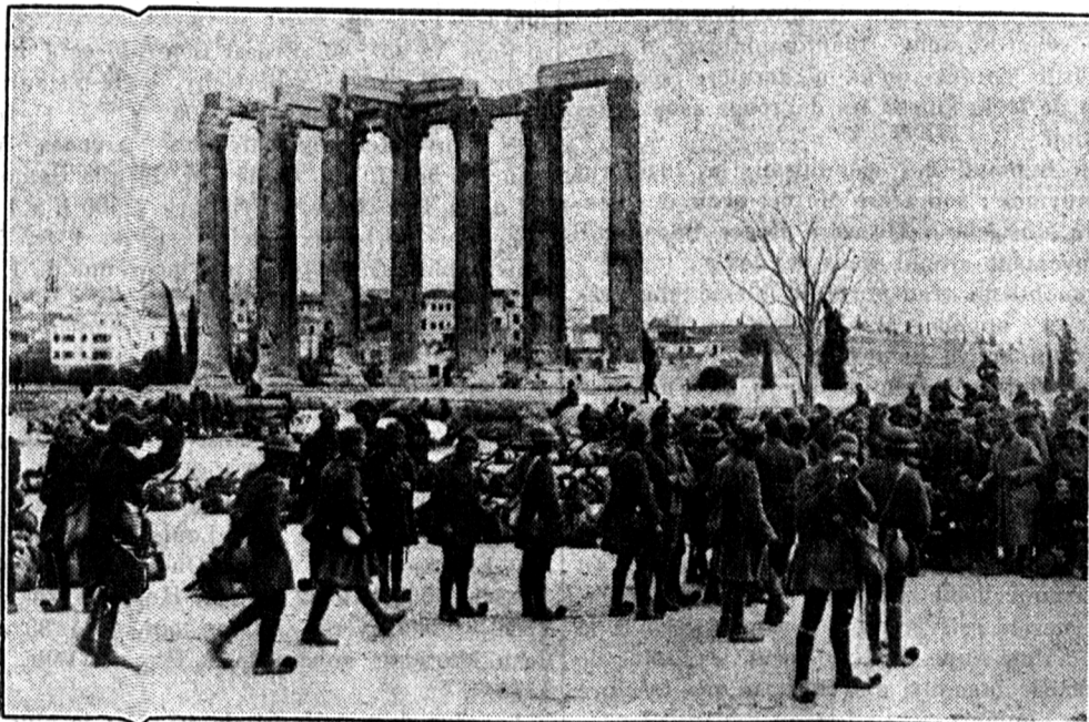
A Athènes, la place devant le temple de Zeus Olympien transformée en camp militaire.

AVIATION Encore de la casse dans l'aviation militaire suisse Hier mardi, entre 11 h. et midi, au champ d'aviation de Thoune, le lieutenant-pilote Magnenat, qui avait fait un vol d'altitude, ne parvint pas à redresser son appareil qui se mit à descendre en vrille. Sautant hors de l'appareil, le lieutenant Magnenat parvint, grâce à son parachute, à toucher terre sain et sauf. L'appareil, un Dewoitine de chasse à une place, le D 27, s'écrasa sur le sol près d'Utendorf. Nos pilotes font beaucoup de casse ! Ça nous revient terriblement cher : 200,000 fr. pour un Dewoitine. L'« estafette » de la Jungfrau Le Sport de Zurich vient de faire paraître les prescriptions réglementant son épreuve de relais. La date retenue est le 16 juin et les relais seront effectués par un avion monté par un ou plusieurs passagers, une automobile ayant à son bord aux moins deux personnes, deux skieurs, un motocycliste, un cycliste et deux coureurs à pied. Le parcours va de Zurich à Dubendorf, Jungfraujoeh, Fiesch, Sion, Lausanne, Dubendorf, Zurich. Le règlement prévoit — nouveauté — que, lors de la transmission par moto et auto sur le parcours Fiesch-Lausanne, des moyennes seront imposées. En cas de mauvais temps, un autre programme sera prévu.