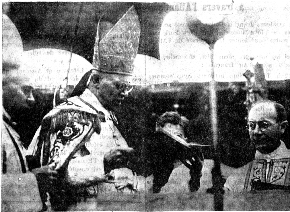
Le cardinal-archevêque de Vienne, Mgr Innitzer, bénissant la première pierre d'une nouvelle église érigée en mémoire de feu Mgr Seipel, qui fut chancelier d'Autriche.