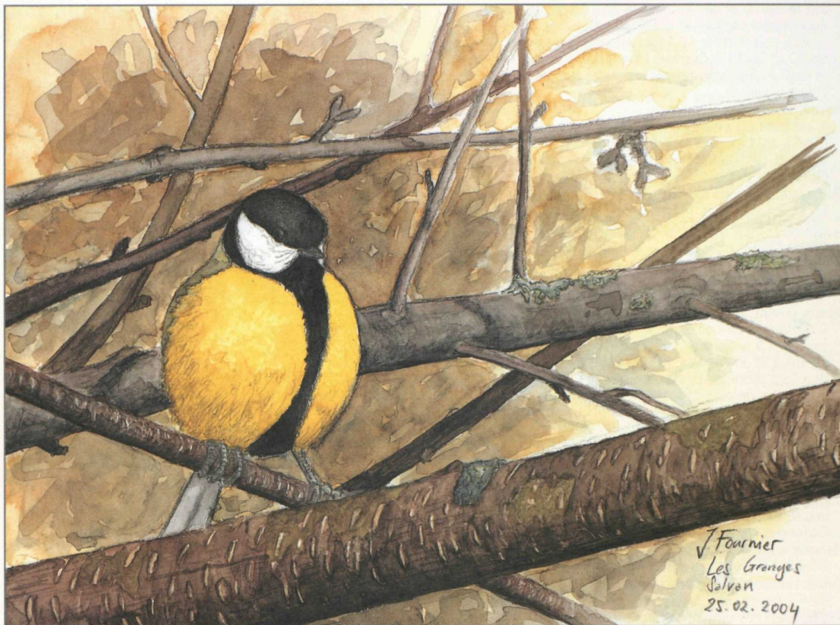
La MÉSANGE CHARBONNIÈRE est une espèce à invasions: certaines années, elle entreprend de véritables mouvements migratoires, perceptibles sur les cols alpins. AQUARELLE JÉRÔME FOURNIER