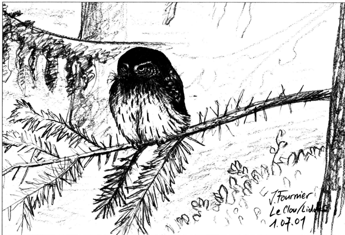
Jeune CHOUETTE CHEVÊCHETTE. – DESSIN JÉRÔME FOURNIER