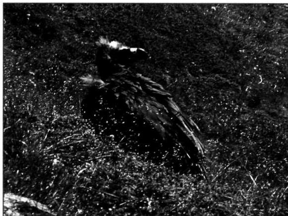
Le jeune VAUTOUR MOINE surpris lors de son incursion valaisanne. Nax, le 13 août 2002.