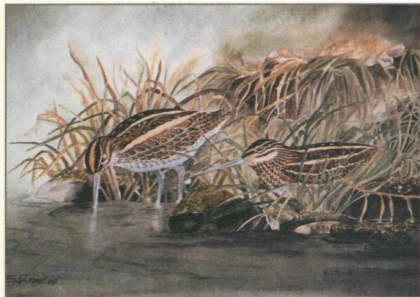
Des BÉCASSINES DES MARAIS ont séjourné cet hiver aux Rigoles de Vionnaz. – AQUARELLE EMILE SERMET