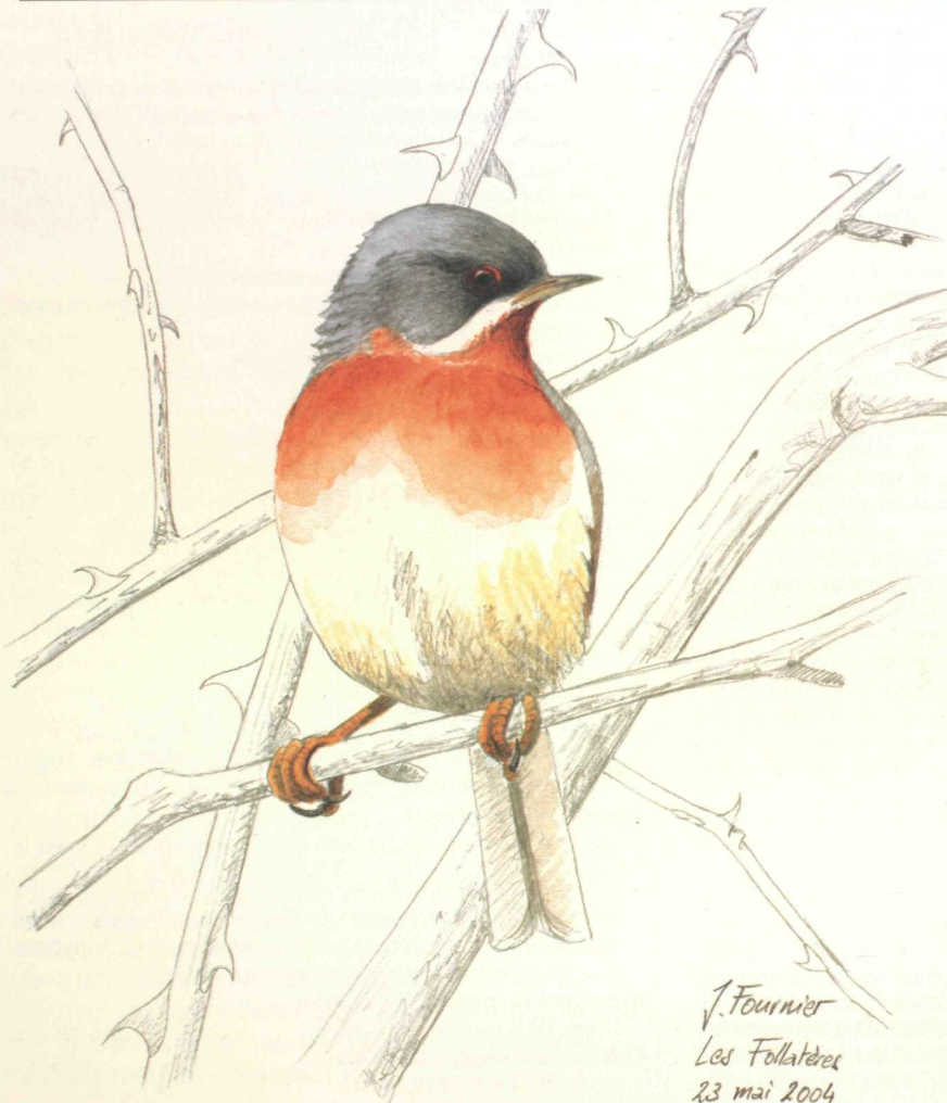
Mâle de FAUVETTE PITCHOU, les Follatères, le 21 mai 2004.