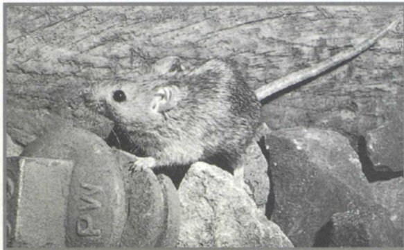
Figure 2 – Souris ( Mus domesticus ) du Simplon.