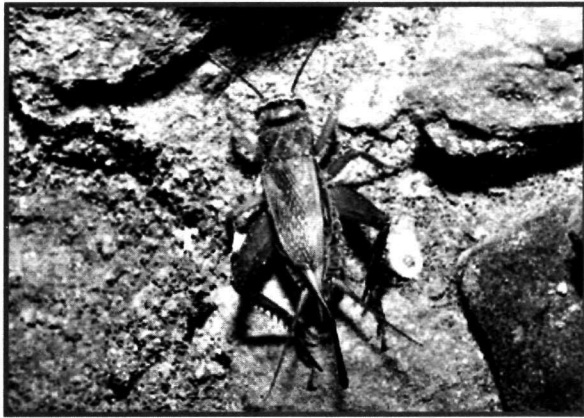
Figure 3 – Grillon domestique ( Gryllus domesticus ) du tunnel. Il s'agit d'une femelle avec son ovipositeur prolongeant son abdomen.

quittait l'abri et se cramponnait sous le couvercle grillagé de la cage. Une des femelles était gestante et a mis bas un seul petit. Mais, après le sevrage, elle ne s'est plus accouplée et les deux autres femelles ne se sont jamais reproduites. A titre de comparaison, 5 souris provenant d'une maison de la Vallée de Joux ont été gardées dans les mêmes conditions: elles n'ont pas du tout manifesté un tel stress et elles se sont reproduites sans problème.