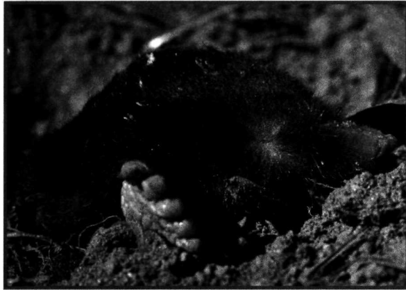
L'œil de la taupe aveugle (ici un mâle de Simplon Dorf) est recouvert d'une membrane opaque (paupières soudées).