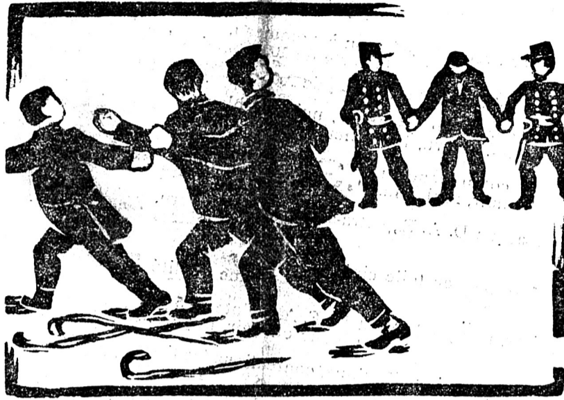
Les ligueurs nationalistes :

— Si tu l'avais entendu parler ! Tout l'auditoire était suspendu à ses lèvres. — Quelle mâchoire !