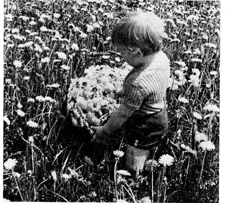
«Gnangnan», «récupérée par la société de consommation», tout ce qu'on veut, la Fête des mères n'en reste pas moins une occasion de rendre un hommage mérité à toutes les mères, une fois l'an. Peu importe la forme sous laquelle vous le ferez dimanche: faites-le! Notre bambin vous suggère d'ailleurs une jolie méthode...