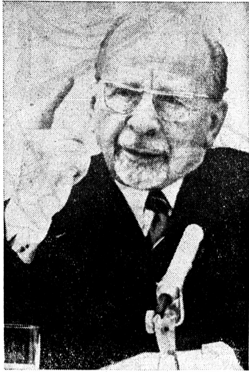
M. Ulbricht, le leader est-allemand, a donné hier une conférence de presse sur les relations inter-allemandes. Celle-ci n'a en rien modifié les intentions de Bonn. D'ailleurs Ulbricht s'est bien gardé de fermer une porte dont tous les observateurs s'accordent à dire que la clé est à Moscou.