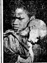
Aide suisse à l'étranger CCP 10-1533