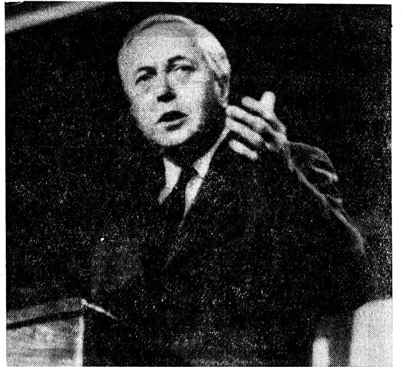
Après le discours d'Harold Wilson, mardi, le congrès travailliste se poursuit sous le signe de l'optimisme prudent, tant en ce qui concerne l'avenir économique de la Grande-Bretagne qu'au sujet des divergences entre le gouvernement et les syndicats dont on ne désespère pas qu'elles puissent être aplanies d'ici au vote final du programme, demain...

L'intervention du conseiller fédéral Schaffner est prévue pour cet après-midi. Aucune décision concrète n'est à prendre: le Parlement est simplement invité à prendre acte de ce rapport.