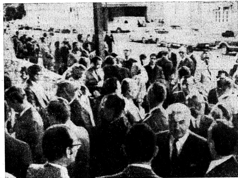
Plus de 900 millions de dollars sont tombés mercredi dans la caisse de l'Etat américain d'Alaska lors de la vente aux enchères de prometteuses actions de pétrole sur la côte arctique. Notre photo montre l'effervescence qui, à Anchorage, comme au temps de la ruée vers l'or, régnait avant l'ouverture des enchères. Cependant, les indigènes ont très peu apprécié cette façon de brader leur territoire et ils ont protesté.