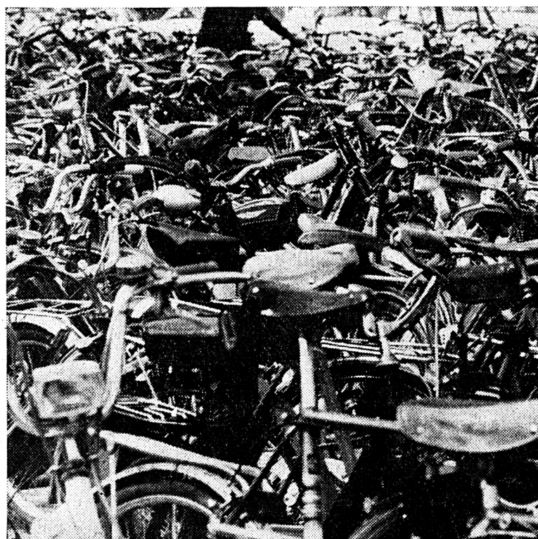
Non, cette photo n'a pas été prise à Amsterdam, paradis légendaire de la bicyclette, mais simplement dans le parc à vélos d'une de nos piscines suisses qui, grâce à l'été favorable, ont connu un beau succès jusqu'à ces derniers jours. On disait que la « petite reine » était morte? Il est vrai pourtant que de plus en plus les « deux-roues » sont motorisés... On souhaiterait en tout cas que ce week-end soit suffisamment dément pour permettre à nouveau une telle affluence sur les lieux de baignade. Malheureusement, la météo ne semble pas très optimiste...