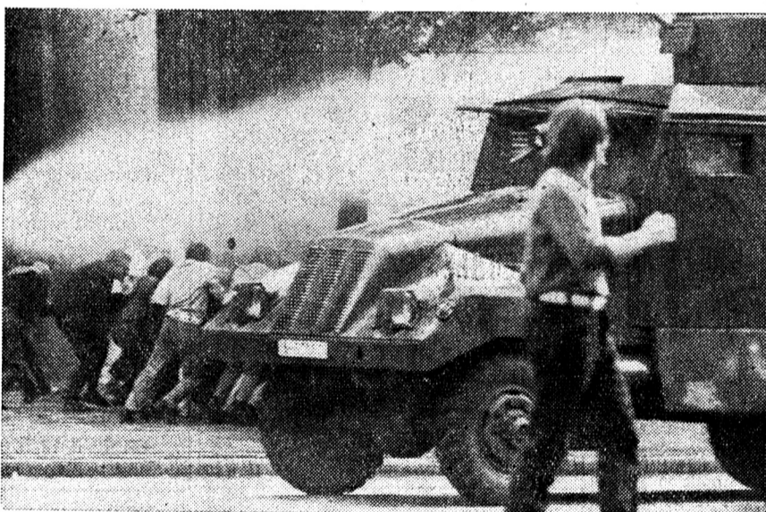
Une scène des manifestations à Prague.

Plusieurs manifestations de sympathie se sont déroulées dans le monde à l'occasion du premier anniversaire de l'entrée des troupes des cinq pays du Pacte de Varsovie en tchécoslovaquie. De telles manifestations ont eu lieu notamment à Stockholm, à Vienne, à Bonn, en Belgique, à New York et au Canada. Chez nous, de telles manifestations se sont surtout déroulées en Suisse alémanique, à Zurich, à Bâle et à Berne notamment. Dans cette dernière ville, plusieurs groupes de manifestants se sont dirigés vers l'ambassade soviétique qui était protégée par la police.