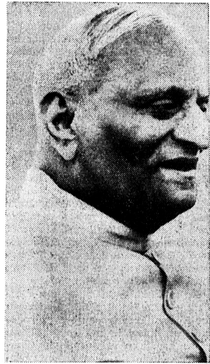
V. V. Giri, dont l'élection marque une victoire dans le « virage à gauche » que semble opérer M me Gandhi.

Le bureau du parti se réunit vendredi ou samedi à Delhi pour étudier la situation. Le président du parti a déjà demandé que M me Gandhi s'explique au sujet de sa rébellion. Il déclare que le bureau aurait à décider si M me Gandhi a le droit de continuer à occuper les fonctions de leader du groupe parlementaire du Congrès.