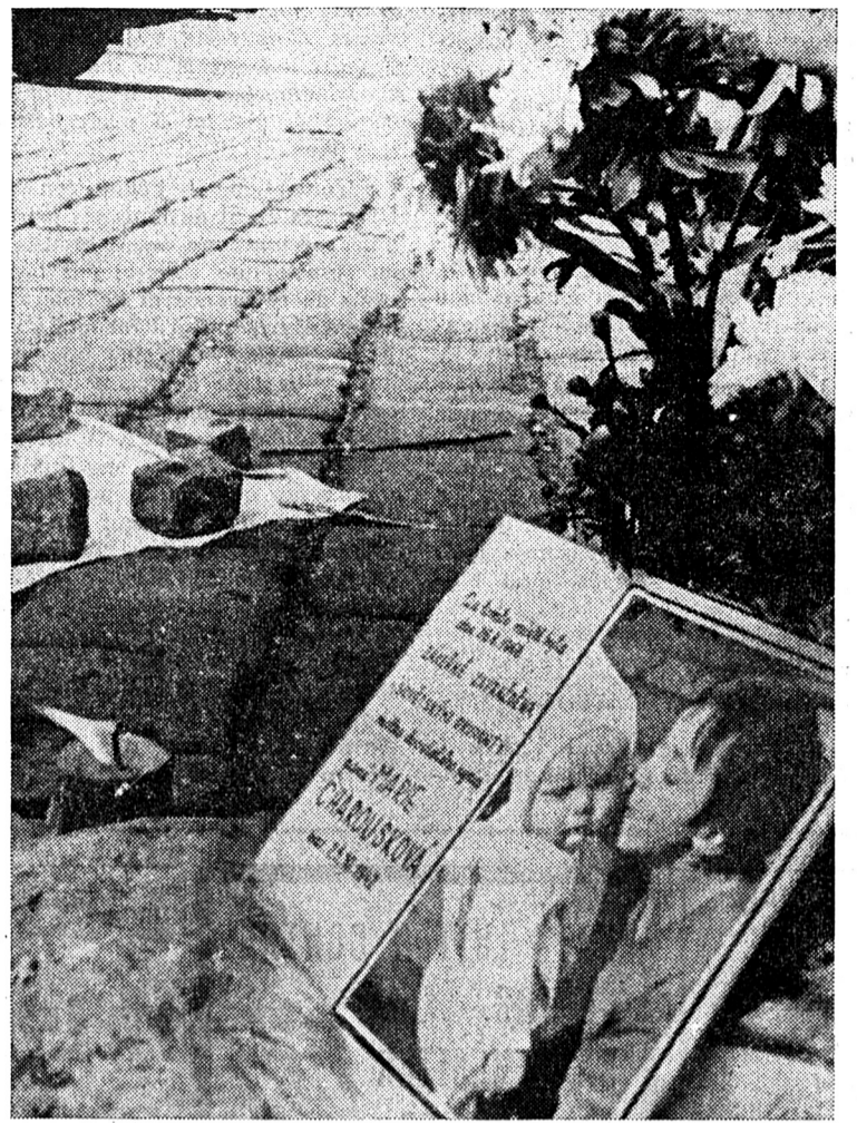
Les Tchécoslovaques n'oublieront pas l'agression soviétique. A l'heure où leurs dirigeants, sous la menace des armes, leur annoncent une période pénible de retour à la censure, à la contrainte, ils honorent leurs morts (notre photo: dans une rue de Prague, l'emplacement où fut tuée une jeune mère pragoise); tout dans leur attitude digne indique qu'ils se plieront, mais ne se résigneront pas.