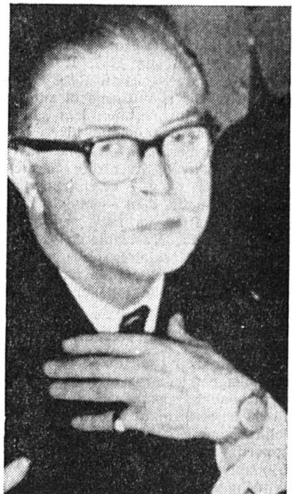
M. G. Eyskens, nouveau premier ministre belge

● BRUXELLES. — Le gouvernement Eyskens est formé. Sa composition définitive a été annoncée officiellement (13 socialistes, 14 chrétiens-sociaux et 1 non-parlementaire) et la prestation de serment devant le roi a eu lieu hier soir. Le gouvernement se présentera devant le Parlement la semaine prochaine seulement.