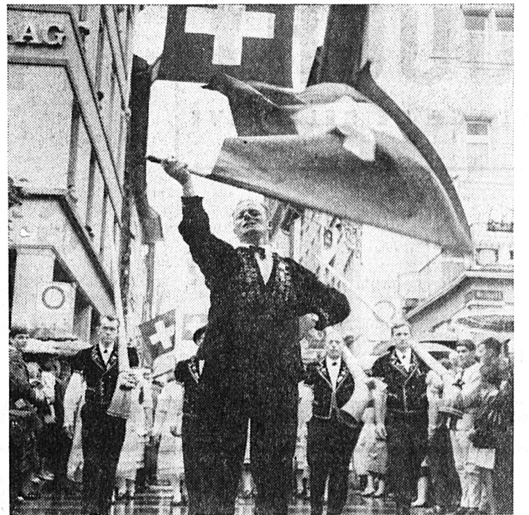
Malgré un temps pluvieux, la XIV e Fête fédérale des jodleurs a connu dimanche, à Winterthur, un grand succès. Plusieurs centaines de groupes de jodleurs et de musique folklorique ont participé au cortège. Notre photo montre un groupe de lanceurs de drapeaux.