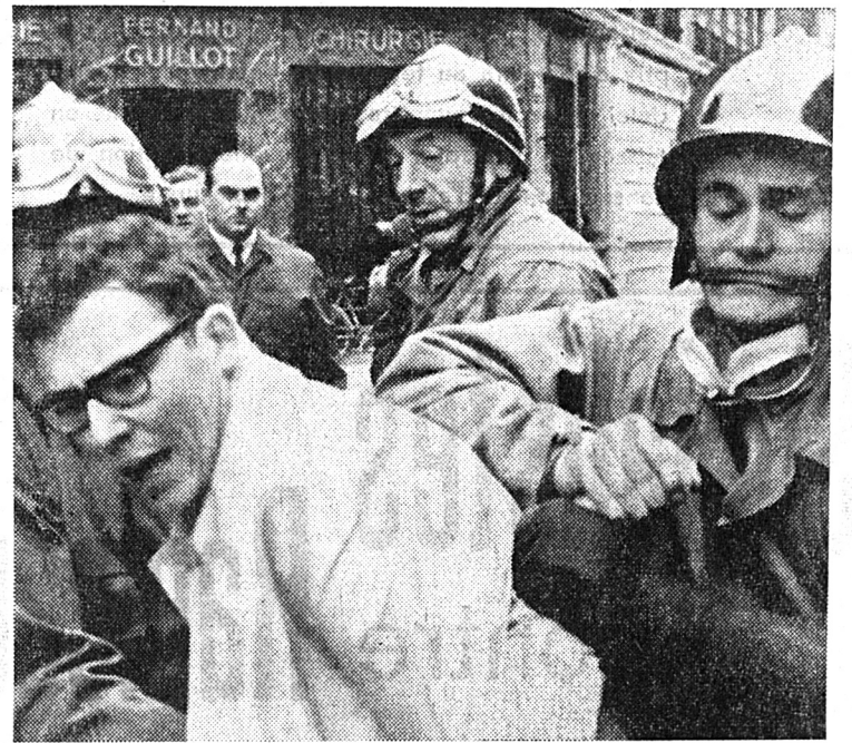
Trois cent quarante-cinq blessés, 422 arrestations, 40 véhicules endommagés: tel est le bilan des manifestations estudiantines de lundi à Paris. L'agitation n'a pas cessé hier, et de nouvelles manifestations, quoique moins violentes, ont eu lieu jusque tard cette nuit. Mais les étudiants ne sont pas seuls à exprimer leur mécontentement: les chauffeurs de taxis, les postiers, les ouvriers et les paysans de l'Ouest sont en grève ou vont l'être.