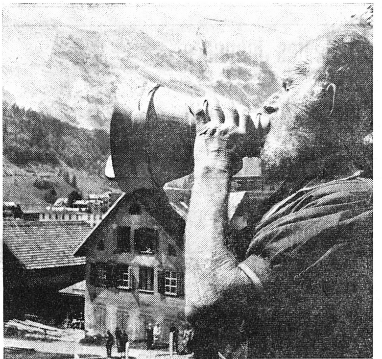
La traditionnelle bénédiction de l'Alpe est proclamée chaque soir à Engelberg, comme le veut une vieille tradition.