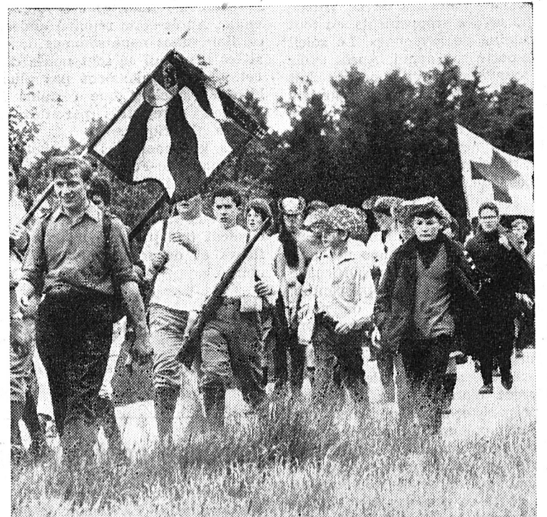
Par un temps magnifique, la septième marche suisse de deux jours, qui a eu lieu ce week-end dans les environs de Berne, a été un grand succès par la participation de 8500 voyageurs à pied en 1200 groupes. La participation nombreuse de la jeunesse a fait une grande impression. Notre photo montre un groupe de jeunes participants.