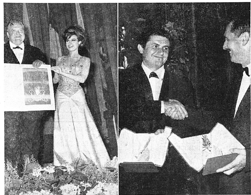
Le Grand Prix du Festival du film à Cannes, la « Palme d'Or », a été remis à deux productions en même temps : au film français « Un Homme et une Femme », de Claude Lelouches, et au film italien « Signori e Signori », du socialiste Pietro Germi. Notre photo de droite montre Claude Lelouches (à gauche) et Pietro Germi. La photo de gauche montre Orson Wells, qui a reçu un prix spécial pour son rôle dans « Falstaff ».