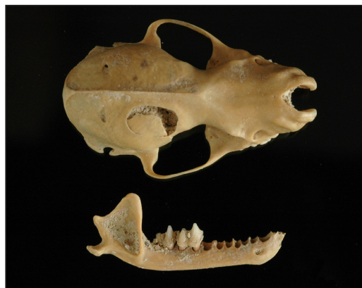
Le Murin de Brandt disparaît de nos échantillons datés au sud des Alpes au Subboréal en même temps que d'autres espèces pourtant tolérantes au froid.

Die vollständige Arbeit ist Gegenstand einer Veröffentlichung im The Holocene . Erste Ergebnisse wurden am Kolloquium der Schweizerischen Kommission (neu: Gesellschaft) für Quartärforschung (CH-QUAT) am 27. Oktober 2007 vorgestellt um im Geographica Helvetica veröffentlicht.