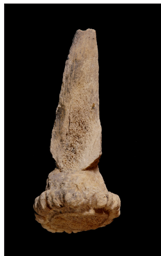
Un fémur humain et un bois de cerf ( Cervus elaphus ) travaillé provenant de la grotte de Bonabé.

Des ossements humains et une faune très diversifiée ont été découverts durant une tentative de désobstruction dans la Grotte de Bonabé, dans le canton du Jura. Les datations radiocarbone d'un tibia humain et d'un charbon ont donné respectivement des dates calibrées de 790-410 BC et 3500-3110 BC, situant le squelette humain au premier Age du Fer. Les couches sous-jacentes datent du Néolithique. On y a trouvé au moins 12 espèces de grands et moyens mammifères, 6 espèces d'oiseaux et 12 espèces de petits mammifères (insectivores, rongeurs et chiroptères). Hormis l'homme, les espèces les plus intéressantes