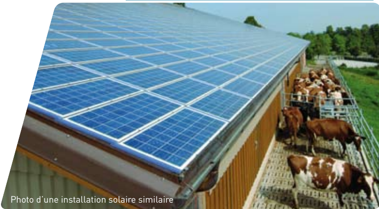
Photo d'une installation solaire similaire

« ...contribuer de manière concrète à la production d'énergie renouvelable non polluante... »