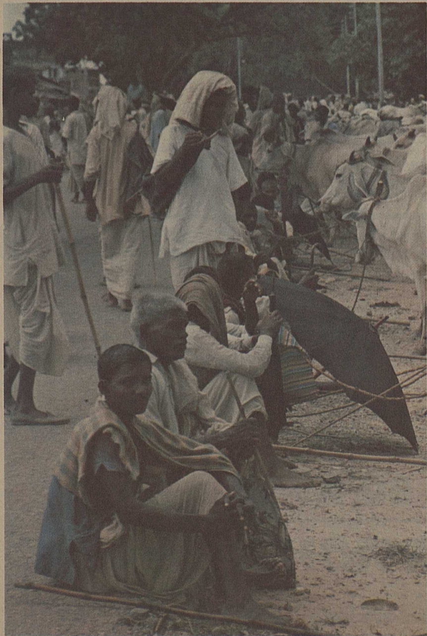
Marché de bœufs dans un village proche de Delhi