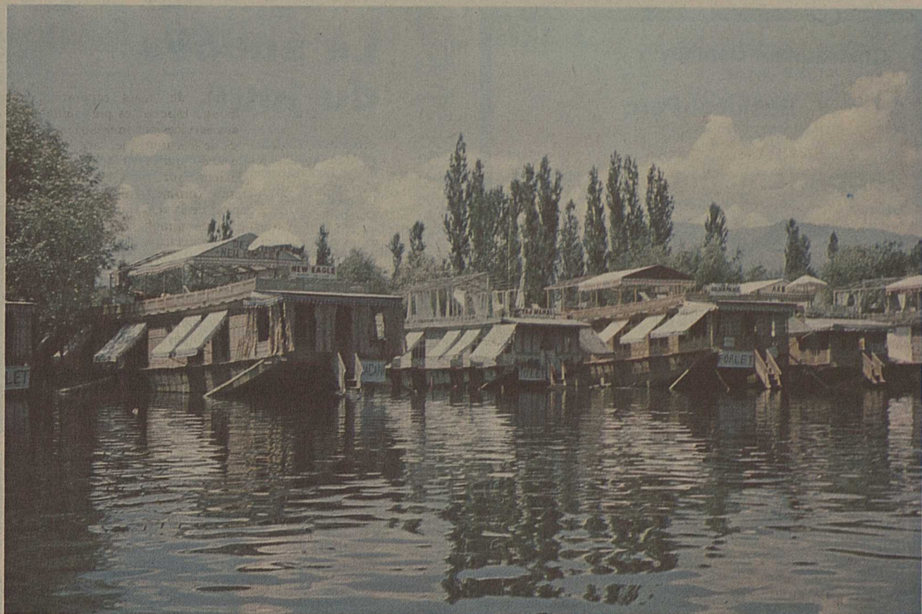
Houseboat sur le lac de Srinagar

Le troisième jour, après avoir dévoré un bon nombre de chapatis (galettes de farine grillée), nous allons attaquer le premier col de 4000 m. La pente est raide et nous ne sommes pas les seuls à chercher notre souffle. Hommes et bêtes ont leurs pauses. Les chevaux robustes sont attentifs aussi où