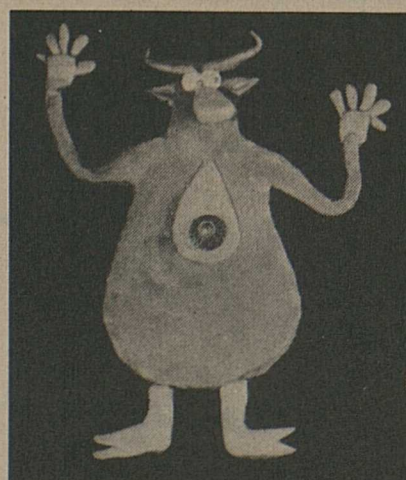
Mardi 6 à 18 heures. « TV-Jeunesse » La boîte à surprises. Le gentil petit diable.