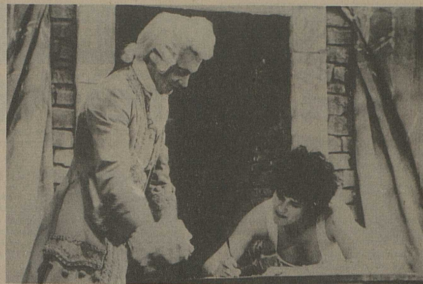
Vendredi 9 à 20 h. 15. « Spectacle d'un soir ». L'impresario de Smyrne. D'après Carlo Goldoni, présenté par le T-ACT (notre photo).