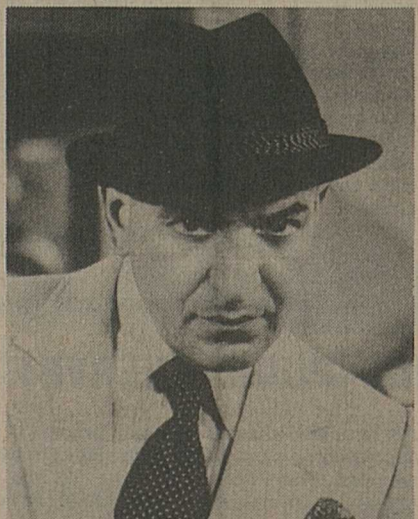
Jeudi 8 à 21 h. 15. « Kojak ». 1. Fausse piste. Avec Telly Savalas (notre photo) dans le rôle de Kojak.