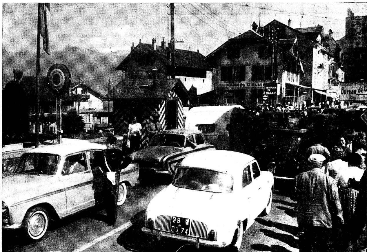
Cette photo a été prise dimanche 20 août à 15 h 30, de la douane française. Elle n'est pas le fait d'un instant seulement. Cette situation est constante pendant l'été et, même les jours de pluie n'empêchent pas ces embouteillages monstres que douaniers et policiers (suisses et français) s'efforcent de réduire au minimum. Il faudra, et ceci sans tarder, que des projets, on passe à leur réalisation.