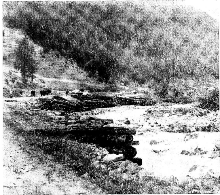
Si la nature a été bouleversée sur quelques centaines de mètres par les flots rageurs du Trient et ses berges emportées, la vie n'en continue pas moins puisque ce troupeau s'en va à l'alpage en musardant le long de la berge gauche, tandis que les flots mugissent encore, furieux de n'avoir pas pu suivre l'itinéraire qu'ils s'étaient donné.

Le « Nouvelliste » de hier matin, a relaté brièvement l'événement. Nous nous sommes rendu sur place. Commençons ce reportage par un peu d'histoire. A peine né, le Trient recueille la Jorneretta, descendue du glacier des Grands, qui le rejoint devant les chalets de Plan Foyer ou Plan des Cercles. Le Trient se dirige tout d'abord vers le N.-N.-E. et traverse le palier verdoyant où sont disséminés les hameaux de Peuty, du Planet et de Gillot (Trient), en recueillant l'apport de différents petits torrents dont le plus important est le Nant Noir, venu du col de Balme.