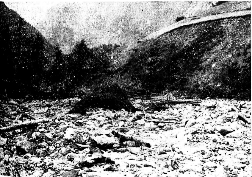
Cette vue a été prise en aval du pont de l'Armier que les flots ont en partie emporté. On remarquera la berge de la rive gauche complètement rongée et les sapins jonchant le lit du torrent.

Vue prise en aval du hameau de Peuty dont on distingue les maisons au fond de notre cliché, à droite. Nous remarquons la route conduisant au col de Balme qui s'est affaissée à la suite de la disparition des berges entraînées par les eaux.