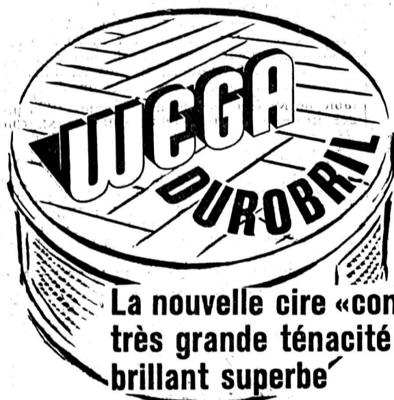
Les portiers ne veulent plus rien d'autre

La nouvelle cire «concentrée» très grande ténacité brillant superbe