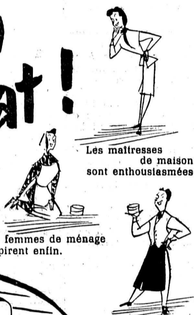
Les femmes de ménage respirent enfin.