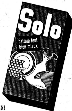
Un produit de marque de Waiz & Eschle S. A., Bâle

Les nombreuses expériences faites en lavant la vaisselle ont prouvé que pendant le même laps de temps et avec une concentration égale, le rendement était jusqu'à 3 fois supérieur en employant le merveilleux SOLO. Pas de frottage, pas de rinçage, pas d'essuyage! Le baquet même est propre, sans cercle graisseux!