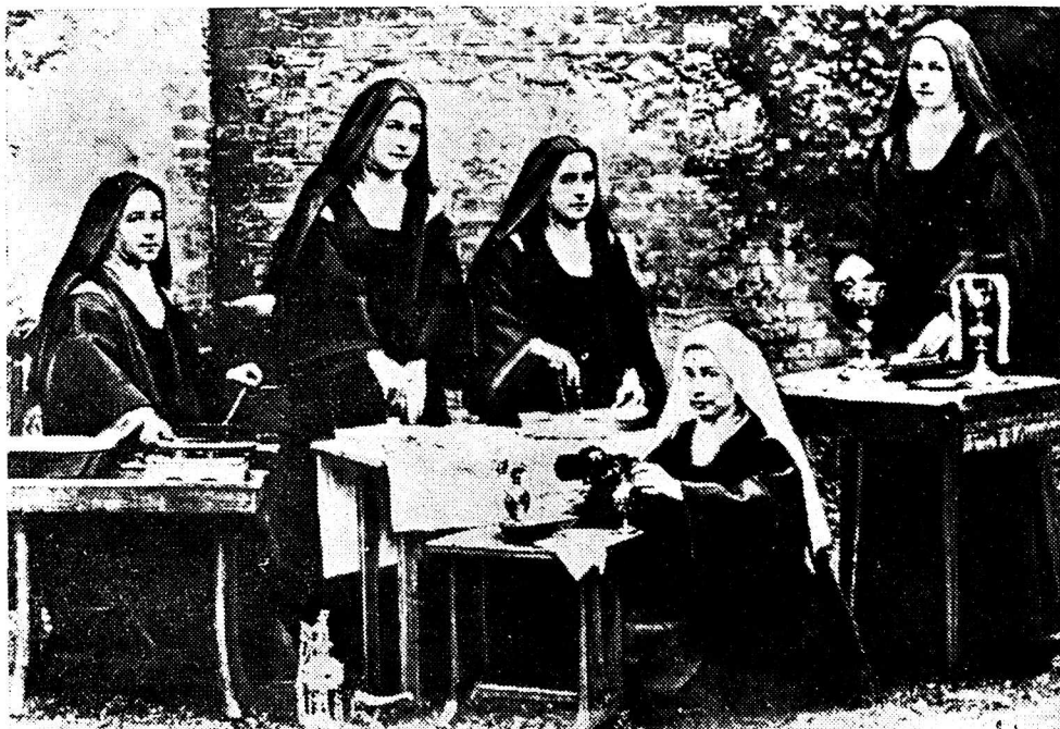
Le 3 octobre était le 25e anniversaire de la proclamation de Ste-Thérèse de l'Enfant Jésus, patronne des missions. La voici, à droite avec ses sœurs au Carmel de Liéieux.