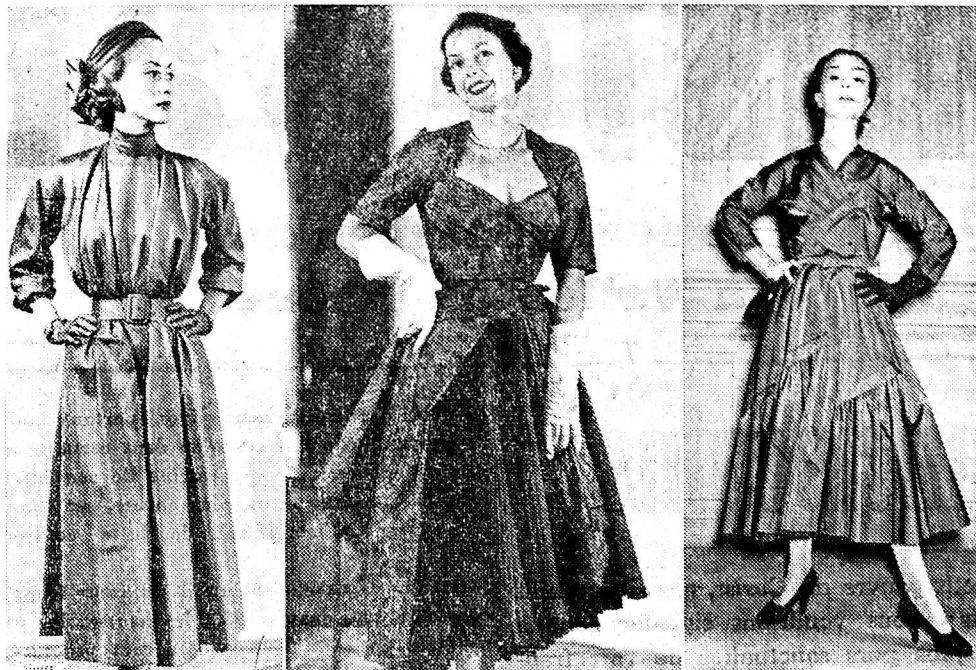
Traînée dans un taffetas mousseline vert prairie, cette robe d'après-midi est à la fois élégante et pratique. Ses manches montées en-dessus de l'épaule, son col officier, son corsage souple et la longueur de sa jupe bien au-dessous du mollet, en font une robe très hiver 1952. Création : Maison Bruyère. — « Cancan » est une robe de cocktail en taffetas imprimée sur chaîne bleu et noir. Elle s'ouvre sur une double jupe d'organdi plissé, bleu changeant et elle plonge légèrement dans le dos. Création : Maison Paquin. « Olympe » est une robe d'après-midi. L'effet original est obtenu par un biais sur la blouse et la jupe ainsi que le drapé. Création : Pierre Clarence.

demandant des renseignements sur notre genre d'existence, et, stupéfaits, dédaigneux, se regardant entre eux et disant : « Quoi, c'est ça la terre, ce lieu que nous croyions être le rendez-vous de toutes les délices, les tourments, le désordre. Pas de relations avec ces gens-là. Ce ne sont pas des fréquentations pour nous. »