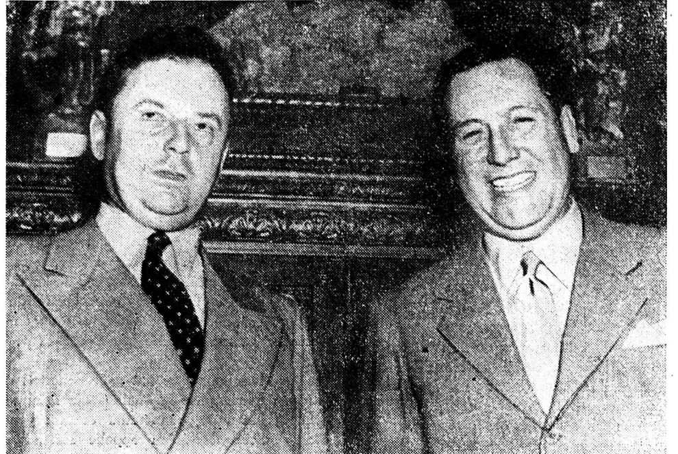
Suivant les rumeurs qui nous parviennent de l'Amérique du Sud, il semblerait que le professeur R. Richter, celui qui, il y a peu de temps encore, était comblé de bienfaits par le président Peron, en suite de découvertes sensationnelles dans le domaine de la production atomique, est non seulement tombé en disgrâce, mais qu'il aurait été arrêté. — Voici le dictateur, président Peron (à droite) et le professeur R. Richter, lors de la dernière rencontre à Buenos-Aires.