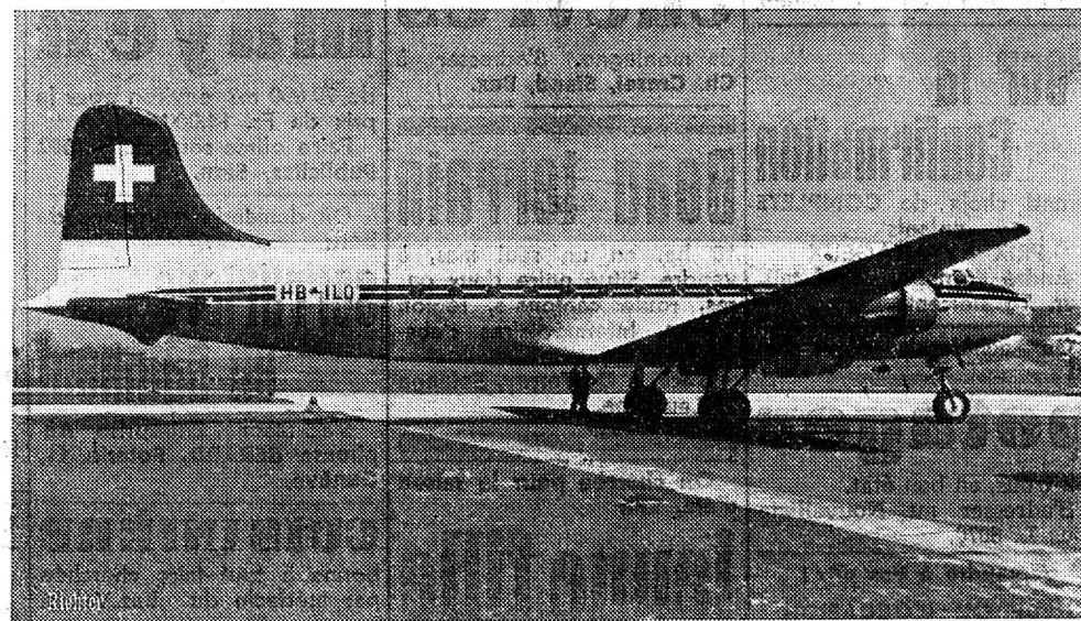
Les avions de la Swissair

06.00 Messe. 06.30 Premier départ des cars pour Van d'En-Haut. 10.15 Premier départ Dames. 10.30 Premier départ Messieurs. 15.30 Proclamation des résultats à Van d'En-Haut.