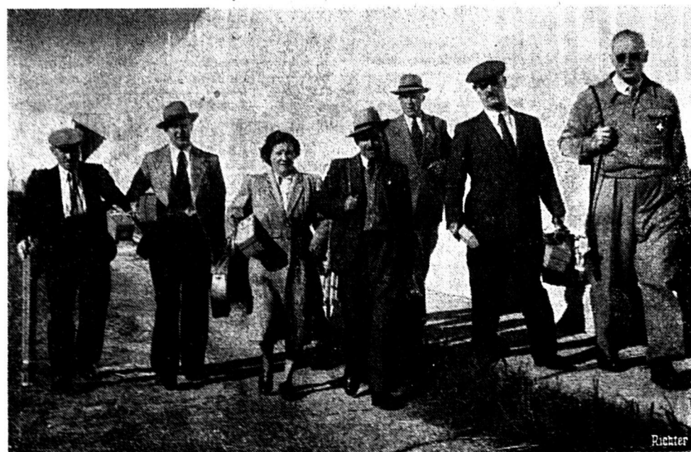
Un fidèle groupe de Suisses à Buenos-Aires

qui se trouve parmi ceux qui défendent nos couleurs à Buenos-Aires, devient champion du monde position couchée à l'arme libre