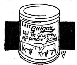
LAIT GUIGOZ S.A. VUADENS (GRUYÈRE)