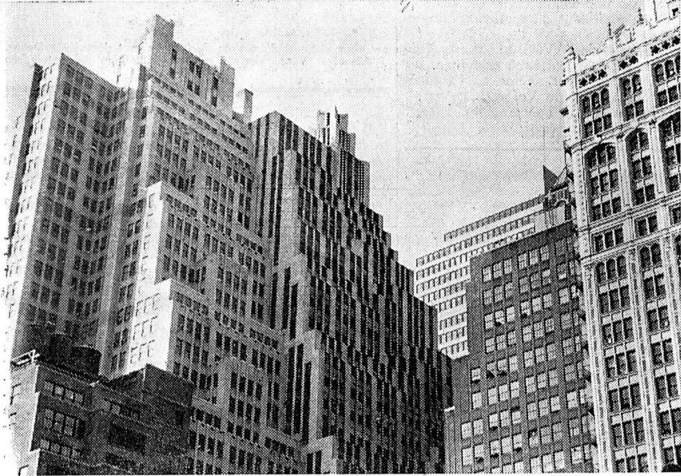
A gauche, un gratte-ciel à l'usage de bureaux dans le quartier de Manhattan (New York).