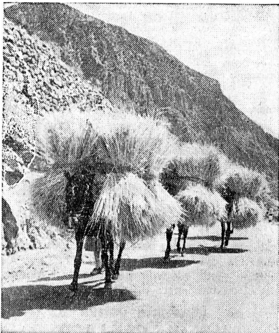
Dans les régions montagneuses, les céréales moissonnées sont chargées sur des mulets et des ânes qui les descendent en les balançant. Les gerbes sont toujours placées à la verticale, car aucun grain ne doit tomber au sol.

che, dans les pays sous-développés, le temps est quelque chose qui ne coûte rien et dont chacun possède ample provision. Voilà pourquoi leurs habitants disposent d'heures et de jours en abondance qui ont un effet tonique sur le cœur et les nerfs. On imaginerait difficilement que les théoriciens de la diététique moderne puissent trouver audience en Grèce. Et pourtant, en dépit de l'infériorité