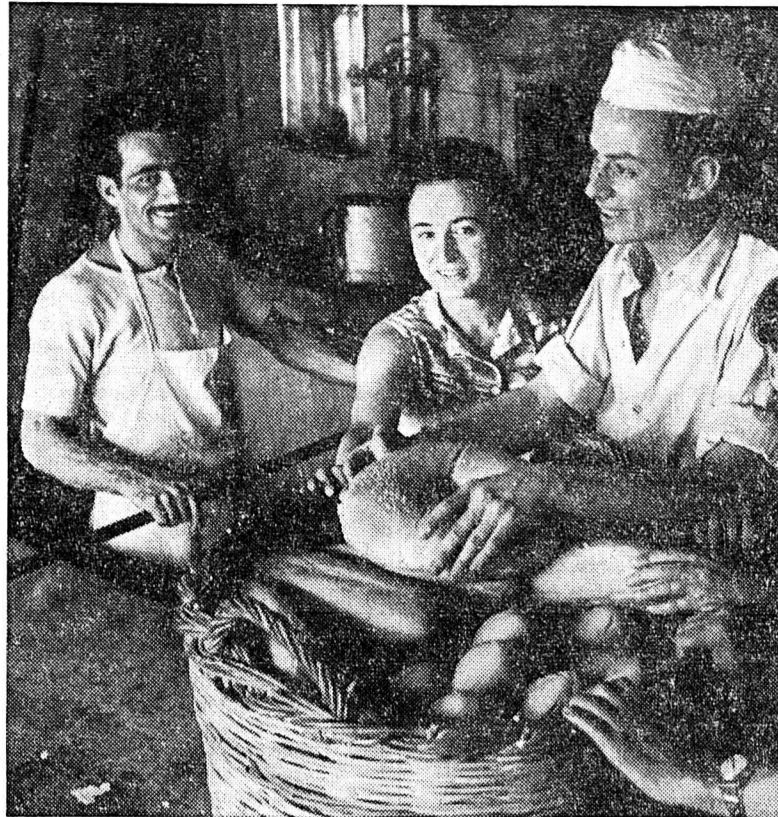
Chaque matin, la population de villages entiers émigre aux champs en passant près des terres fertiles et aussi le long de ces terrains en jachères qui ne peuvent pas supporter la culture annuelle. Seule la route goudronnée nous sommes en plein XX e siècle. Car les paysans eux-mêmes, leurs attelages et leurs outils aratoires ne diffèrent guère de ceux d'il y a un siècle ou deux.

technique qu'on remarque en général dans le pays, on y vit de façon très moderne, c'est-à-dire sans excès et, quand les moyens ne sont pas trop mesurés, de manière très saine. L'alimentation populaire de base repose sur une grande consommation de légumes, de fruits, de noix, sur le fromage au lait de mouton et de chèvre, sur le yoghourt et, surtout, sur toutes sortes de pain.