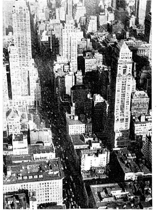
Perspective depuis la terrasse du 86 e étage de l'Empire State Building sur d'autres gratte-ciel et, 320 m. plus bas, sur le dédale des rues de la 5 e Avenue.

Leur grand rayon d'action permet de relier directement l'Ancien et le Nouveau-Monde, avec une provision de 29.600 litres d'essence. Les perfectionnements apportés aux moteurs ont augmenté encore leur rendement et permis d'accélérer la vitesse et de raccourcir encore la durée du trajet Genève (ou Kloten) New York, puisque la vitesse horaire est en moyenne de 565 km. et peut atteindre 580 km. Le vol New York-Suisse, 6440 km., s'effectue directement, tandis qu'à l'aller, où il faut toujours compter avec des vents contraires, l'horaire actuel prévoit encore une escale à Shannon (Irlande). Certaines courses font également escale à Francfort pour prendre les passagers en provenance d'Allemagne, et l'on prévoit plus tard une escale à Cologne.