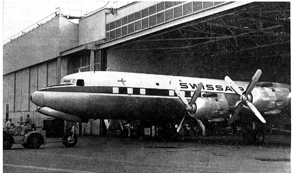
A droite, un DC-7C devant les ateliers des usines Douglas à Santa Monica (Californie), où travaillent 25.000 ouvriers.