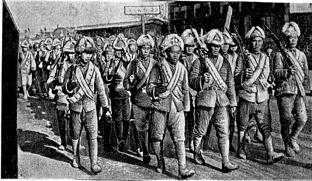
Des troupes chinoises ont occupé le pont de Marco-Polo à Wanpingh-sien.

Les billets dont le No se termine par 4094, 8473, 5476, 0173, 6953, 0471, 8077, 8665, 5695, 5120, 5158, 0389, 7410, 6317, 0943, 7816, gagnent 50 fr.