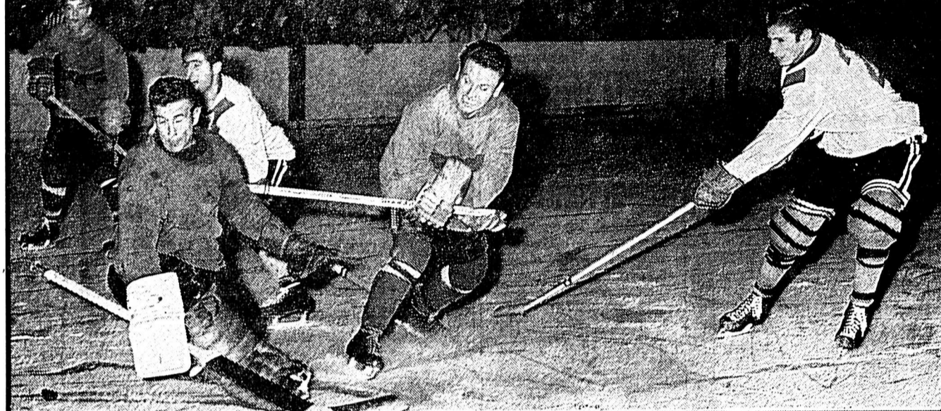
En haut: le premier but du HC Sion... En bas: sur une attaque dangereuse de Pillet, Birchler est battu...