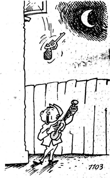
Aide au malheureux

Mesdames, Mesdemoiselles, je suis votre ami! Votre défenseur à l'occasion, votre admirateur et «supporter» toujours!