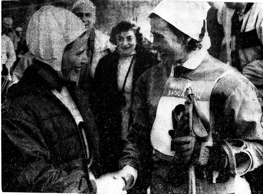
Les médailles d'or des disciplines alpines semblent être l'apanage, aux Championnats du monde de ski alpin à Bad Gastein, des pays non alpins.