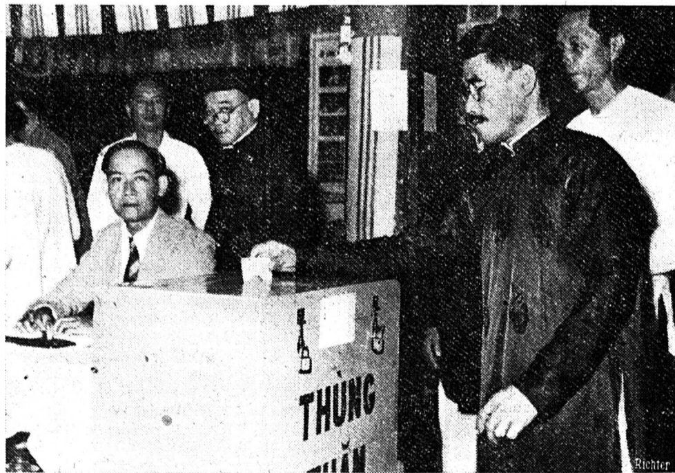
Pour la première fois dans leur histoire, les Viet-nahmiens ont participé à des élections libres pour désigner les conseils communaux. Notre photo représente un professeur déposant son bulletin dans l'urne au village de Bentré (sud du Viet-nahm).