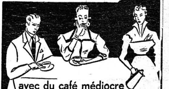
avec du café médiocre