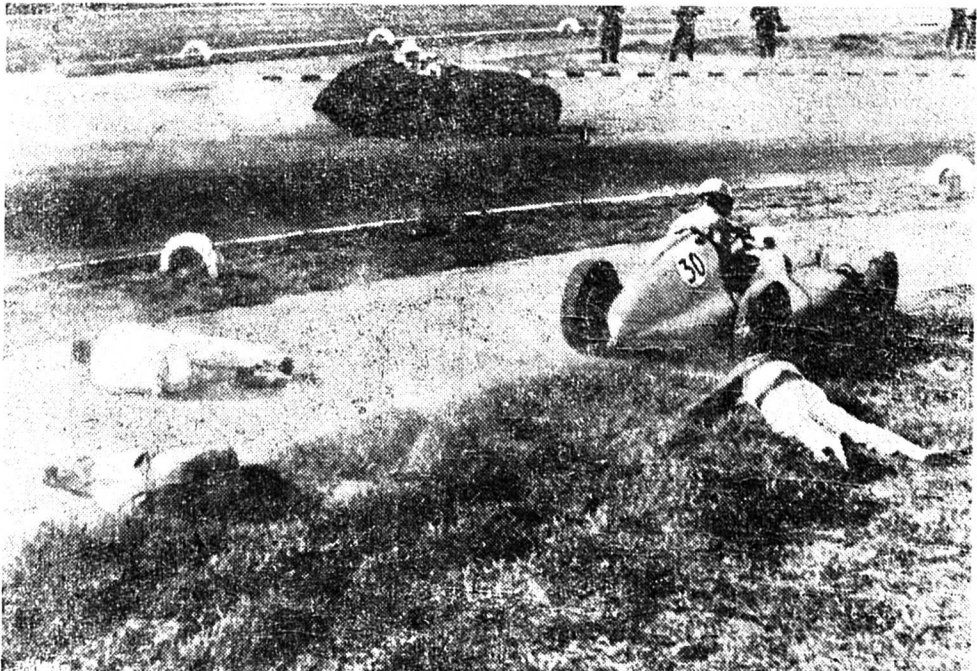
Lors d'une course de voitures, un bolide (No 30) manquant son virage, a renversé et grièvement blessé trois spectateurs. Le photographe, ayant échappé par miracle à l'accident, a eu la présence d'esprit de prendre cet instantané saisissant.