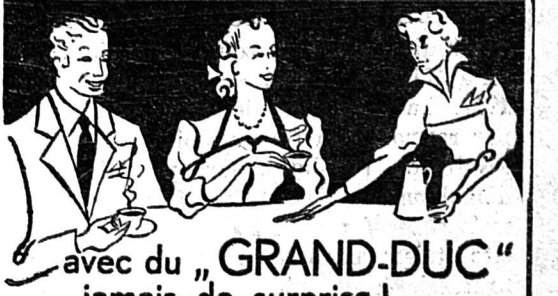
avec du « GRAND-DUC » jamais de surprise !

Mélange : Brésilien Coracoli Mocca Colombie Viennois