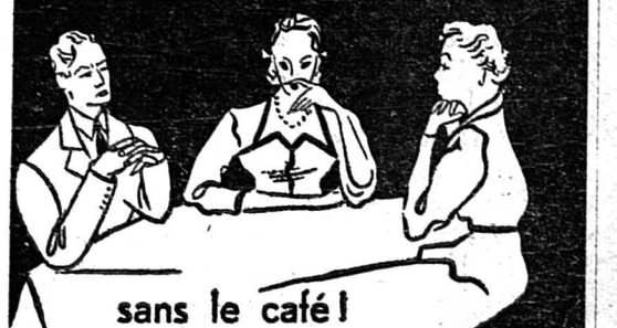
sans le café !