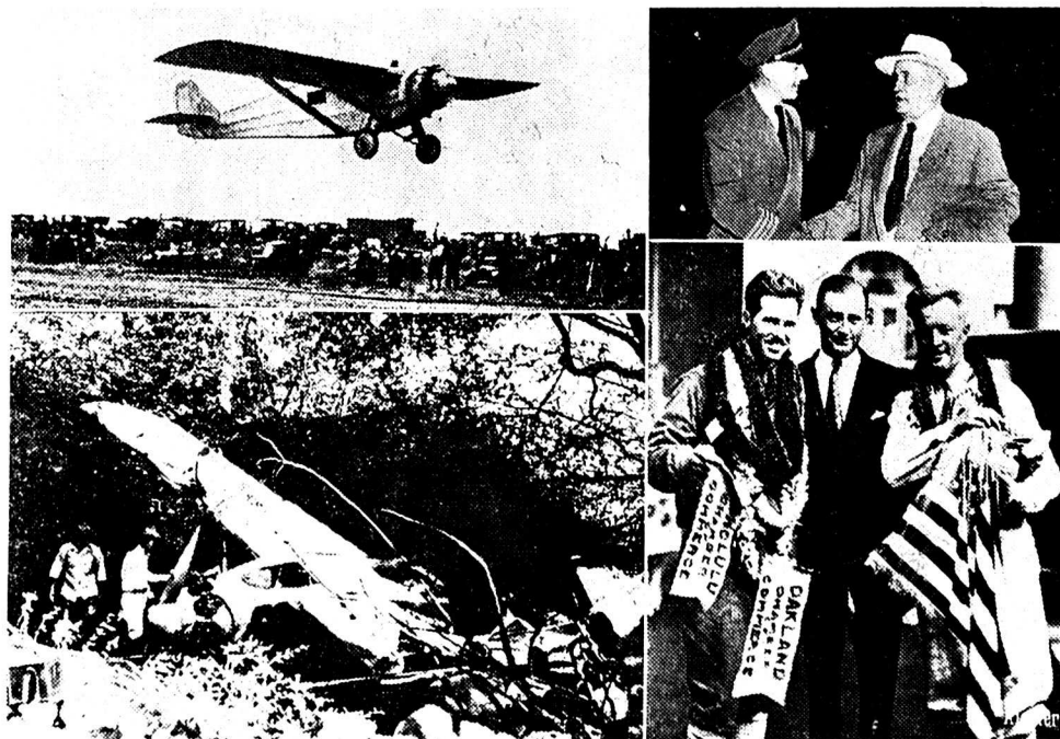
Ernie Smith, le premier pilote qui franchit le Pacifique à bord d'un avion — il y a exactement 25 ans de cela — fait, pour cet anniversaire, le tour du monde en touriste. Il a passé à Paris. Le 14 juillet 1927, il s'envolait à bord d'un monoplan monomoteur avec un navigateur, Emory Bronte. Partis d'Oakland (Ohio), après avoir franchi le Pacifique — plus de 4000 km., les deux hommes faisaient un atterrissage de fortune 100 km. avant Honolulu. A gauche : le départ et l'avion après l'atterrissage dans la jungle. A droite : en-haut, lors de son arrivée à Paris il y a quelques jours. A droite et en bas, lors de son triomphe. A g. : le navigateur et Smith à droite.