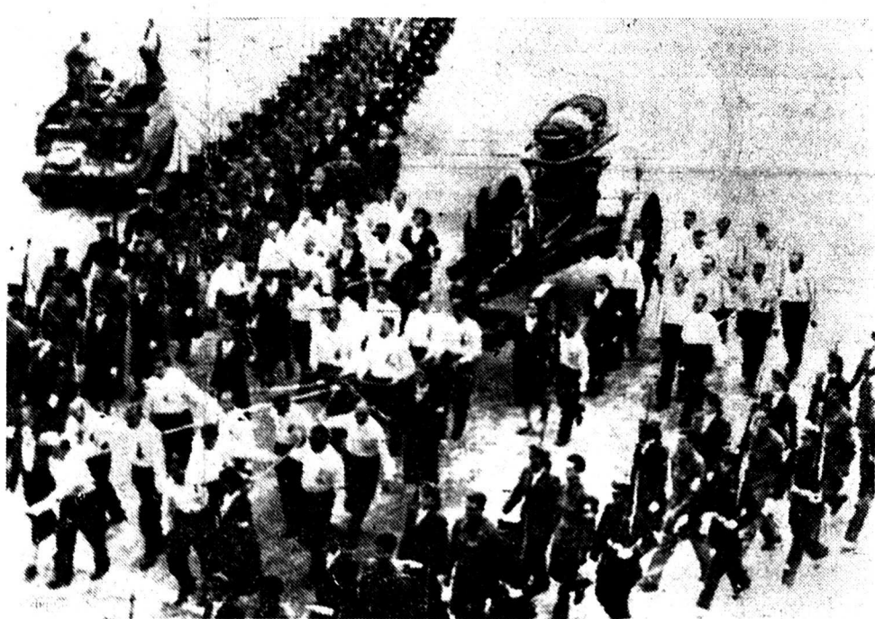
Des ouvriers tirent l'affût sur lequel le cercueil a été posé, et que l'on transfère du Ministère du Travail au Palais des Congrès. Une foule considérable était accourue et 20.000 soldats rendirent les honneurs à Buenos-Ayres.