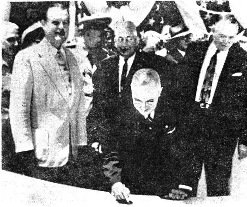
Le président Truman pose la quille du premier sous-marin atomique Cette technique nouvelle de l'utilisation de l'énergie atomique marque certainement le début d'une ère nouvelle. Ce nouveau sous-marin s'appelle «Nautilus». Le submersible est plus approprié à l'emploi du moteur atomique, car il supporte mieux l'énorme poids des cuirasses de plomb destinées à protéger l'équipage des radiations mortelles du radium.