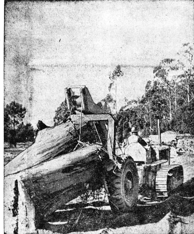
AU CHILI, des machines agricoles importées au moyen de prêts remboursables en six ans et demi accordés par la Banque internationale pour la reconstruction et le développement, permettent à ce pays d'accélérer l'exploitation de ses ressources.

En conclusion nous dirons qu'un « sacrifice de paix » un prélèvement sur le capital ne pouvant être qu'une mesure de salut public les conditions présentes ne sont pas requises pour l'exiger. H. v. L.