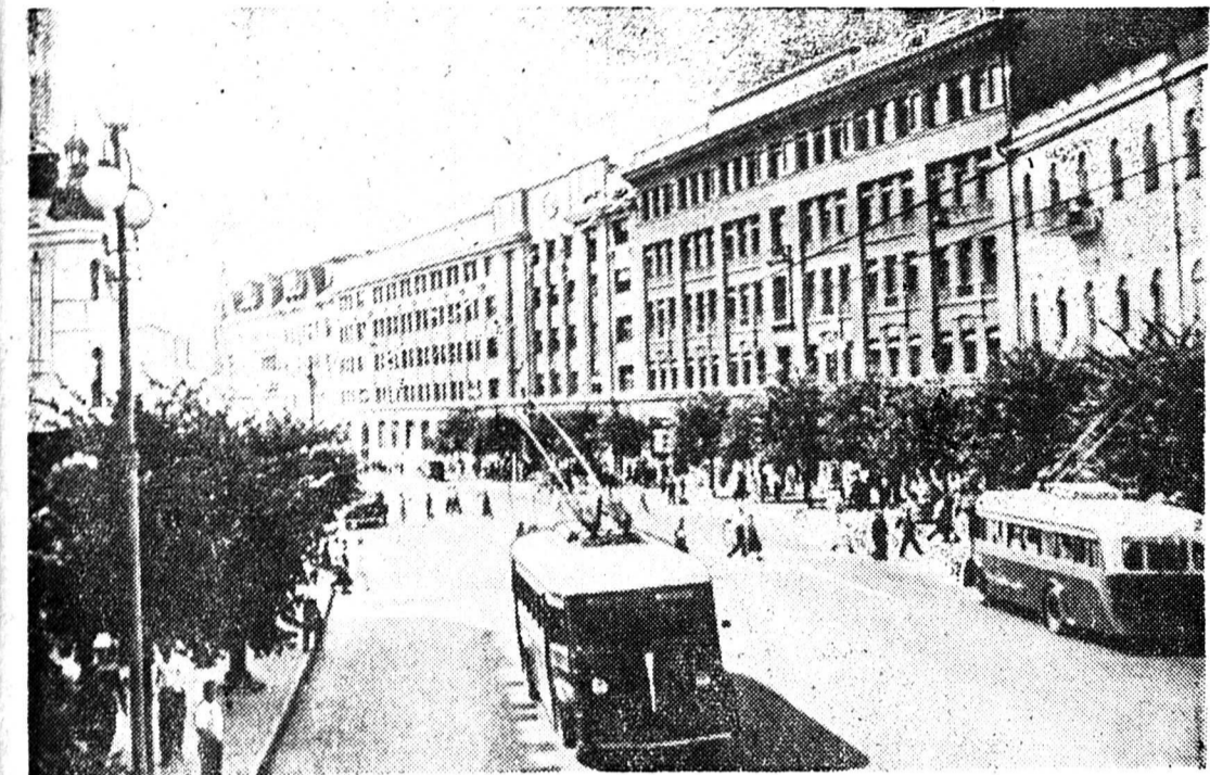
UNE DES RUES PRINCIPALES DE KIEV REPREISE CETTE SEMAINE PAR LES RUSSES

AV. DE LA GARE - SION - TÉL. 2.12.36 - CH. POST. Ilc 485 Succursales en Suisse - Correspondants à l'étranger ANNONCES : la ligne mm., Canton 9 ct. - Suisse 11 ct. AVIS MORTUAIRES : 16 centimes la ligne millimètre. RÉCLAMES : Valais 20 ct., Suisse 25 ct. — Les articles de forme publicitaire doivent être accompagnés d'une annonce.