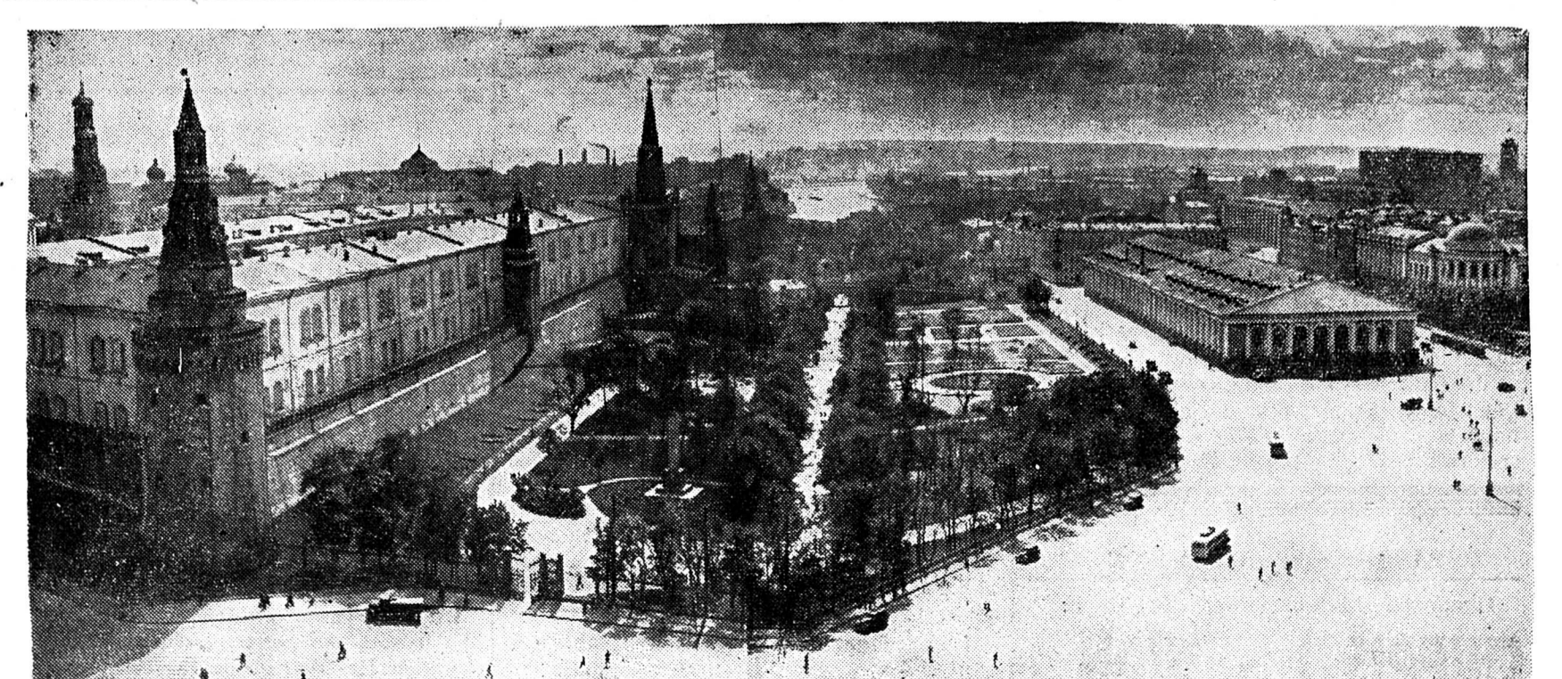
Vue générale de Moscou où se déroula une importante conférence. A gauche, le Kremlin, au centre, le célèbre parc Alexandre.