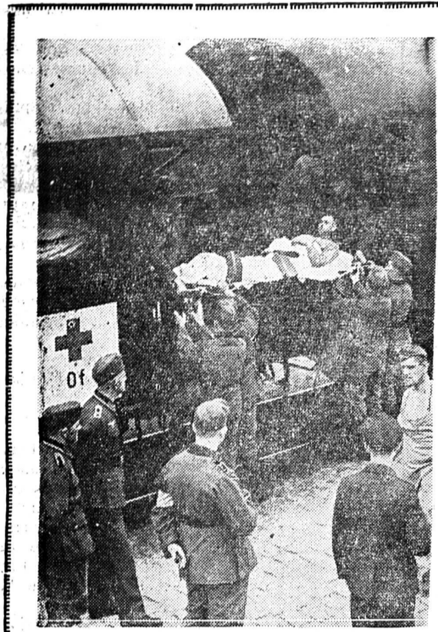
LES PREMIERS BLESSES DU FRONT DE L'EST

SUISSE 1 an Fr 8.— avec Bulletin officiel Fr. 12.50 6 mois „ 4.50 „ „ „ 6.50 3 mois „ 2.50 „ „ „ 3.50 ETRANGER : un an Fr. 16.—