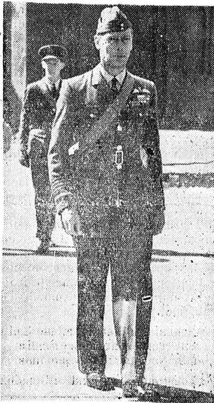
Le ROI GEORGE VI possède, comme tous les citoyens anglais, un masque à gaz. Sa M. est photographiée portant son appareil en bandoulière.