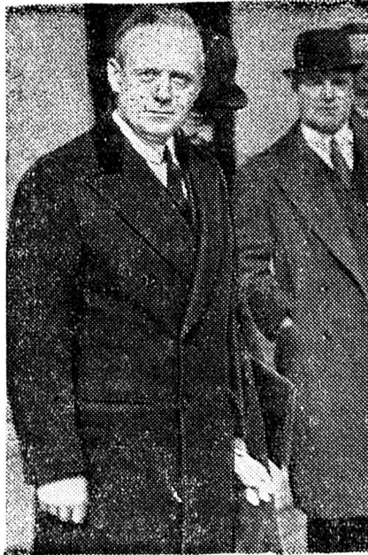
M. von RIBBENTROP Ambassadeur d'Allemagne en Italie