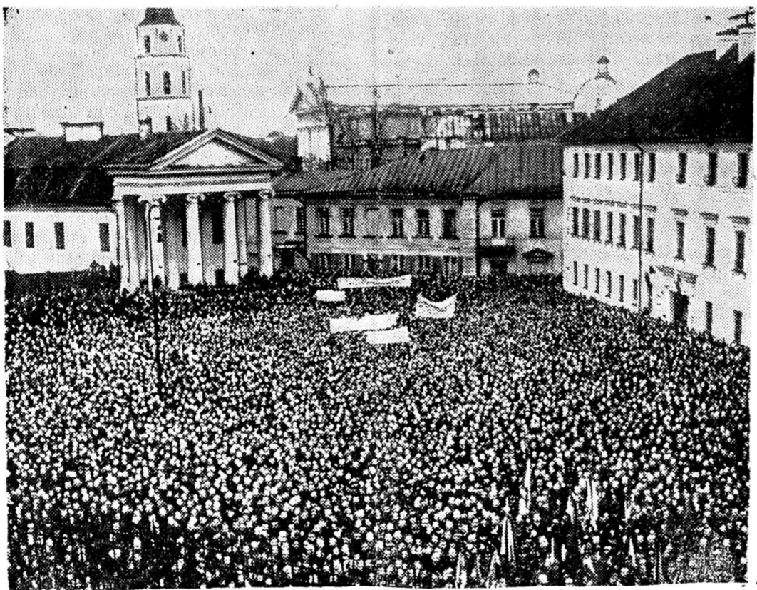
LE RAPPROCHEMENT POLONO-LITHUANIEN Une grande manifestation polonaise a eu lieu à Wilna, ancienne capitale de Lithuanie, à laquelle le pays a renoncé en acceptant l'ultimatum de la Pologne.

Du reste, les critiques affluent en ce qui concerne ce moyen employé pour lutter contre le gel. On prétend — et nous ne sommes pas les seuls à le souligner — que la fumée des gaz et les émanations qui se dégagent des chaufferettes détruisent les oiseaux, les abeilles et sont nuisibles à certaines cultures. Nous croyons savoir que des plaintes ont été adressées aux autorités cantonales et qu'une enquête sera ordonnée à bref délai. Nous espérons donc être fixés d'ici peu.