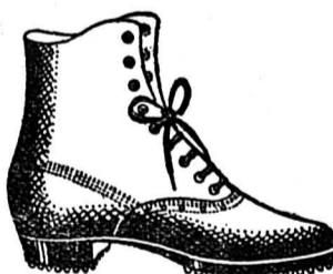
Art. 156. Souliers à lacets pour dames, hauts talons, sans doublure, couture indéfectible, sans couture de derrière, cloués, très solides. No. 36/42 fr. 8.—.