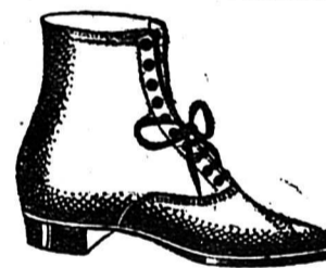
Art. 159. Souliers à lacets pour dames, bonne qualité, hauts talons garnis. No. 36/42 fr. 7.50.