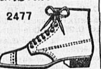
2477 Souliers à lacets pour hommes box-vachette No. 39-48 Frs. 20.-

Nos Souliers sont solides, durables, et par conséquent bon marché. Envoi franco contre remboursement