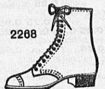
2268 Souliers à lacets pour dames box-vachette No. 36-43 Frs. 19.-