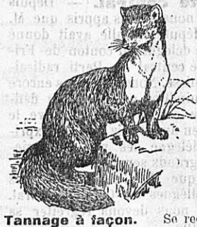
Tannage à façon. So recommande.

Insérez vos annonces dans „La Gruyère“, journal très répandu dans la contrée.