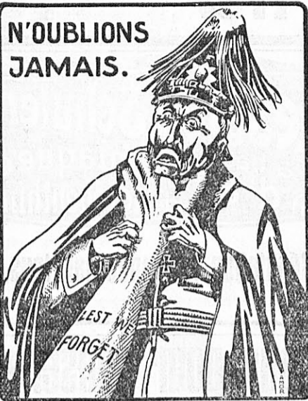
Film de la guerre actuelle

Samedi à 8 h., Dimanche à 3 h. et à 8 h., et Lundi à 8 h. 26, 27 et 28 juillet.