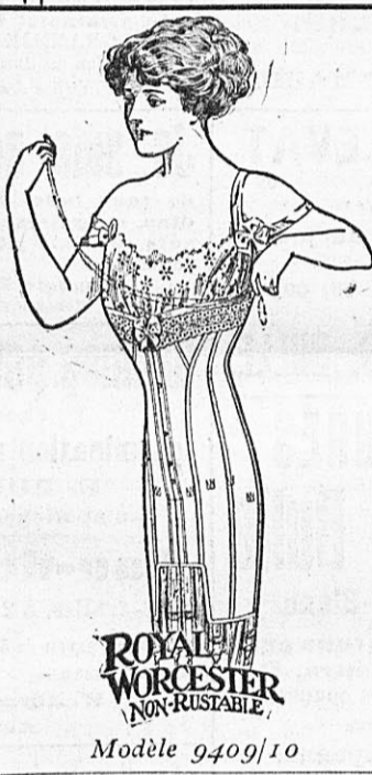
CORSETS en croisé fin, extra fort, garnis soie et dentelles, busc large, forme très longue 4 jarretelles 12. 90