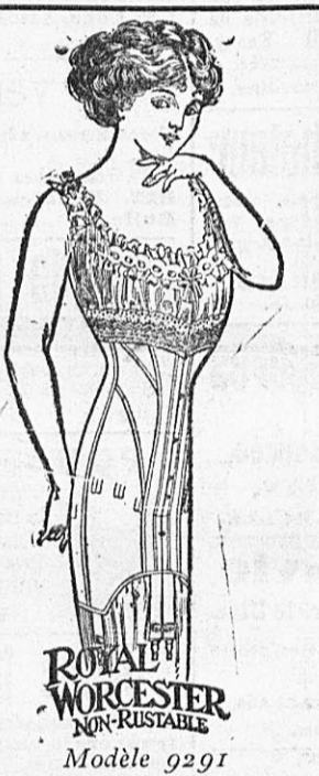
CORSETS en coutil gris, garnis rubans soie et brod., bas de gorge très enveloppant avec jarretelles 10. 90