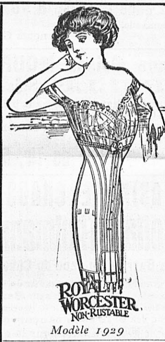
CORSETS en coutil blanc, broché soie, garnis larges dentelles et rubans, baleine spéciale, forme très élégante 6 jarretelles 16. 75