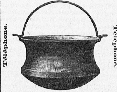
Prix très modérés. [177]

ASSORTIMENT COMPLET d'articles pour fromageries, peaux de caillets, toiles à fromages, etc. Ecrémeuses centrifuges. Grand choix de chaudières, modèle perfectionné, bonne et solide fabrication. [215]