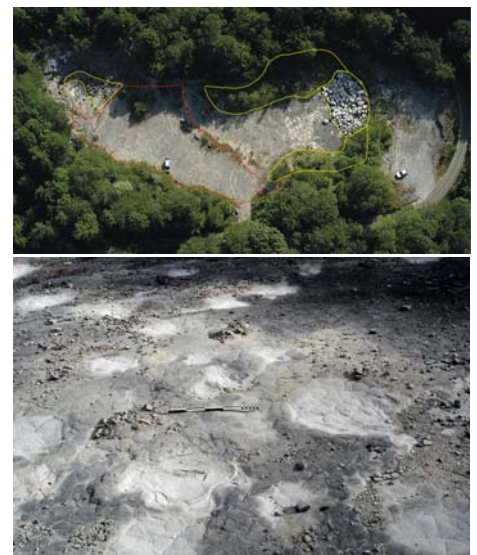
Traces de dinosaures, Loulle (39).

Cette découverte modifie quelque peu le modèle qui plaçait le Jura, à l'époque de l'Oxfordien supérieur, sous une mer peu profonde mais persistante. Il s'avère maintenant que quelques îlots plus ou moins temporaires créaient en ce temps-là un paysage lagunaire sensible aux oscillations du niveau marin.