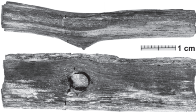
Abb. 19: Auswirkung differenzieller Kompaktion in kompaktionsfreudigen Sedimenten verdeutlicht am Beispiel eines durch einen Belemniten ( Passaloteuthis sp.) durchdrungenen Holzstückes. Fundort: ehemalige Tongrube nahe Marloffstein bei Erlangen. Alterseinstufung: Pliensbachium (?margaritatus-Zone/ Lias). Sammlung CH. KLUG (Zürich).