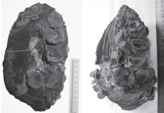
Abb. 16: (L) Aufsicht auf die Oberseite der Kalkkonkretion mit dem postcranialen Skelett im nahezu unpräparierten Zustand. Die Perspektive entspricht der Grenzfläche zwischen Schicht 1A und 1B. (R) Freipräpariertes postcraniales Skelett in nahezu gleicher Ansicht. In (L) und (R) ist die linienartige Anordnung der dislozierten Wirbelkörper ersichtlich. Der von dieser Anordnung deutlich abweichende Wirbelkörper (links unten) verkörpert das Endglied der in artikulierter Form überlieferten Wirbelsäule. 38 L = links, R = rechts.