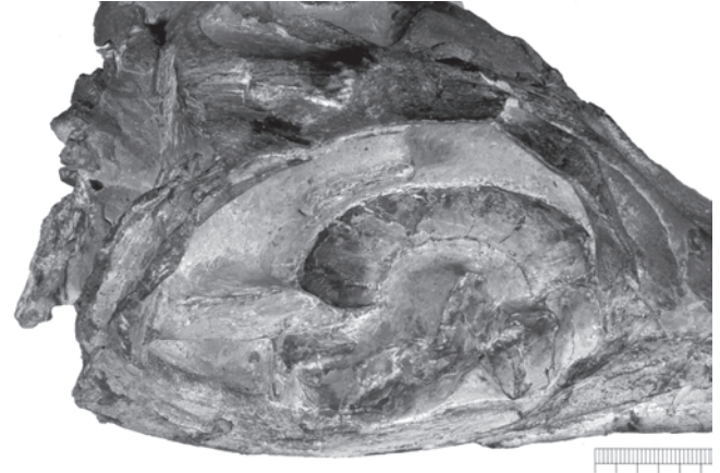
Abb. 17: Detailaufnahme des Hauensteiner Ichthyosauerschädel in linker, ventraler Ansicht (vgl. Abb. 14). Deutlich sichtbar ist der teilweise zerfallene und im Schädelinneren verbliebene Sklerotikalring. Ähnliche Disintegrationserscheinungen sind z.B. in VON HUENE (1922) abgebildet.